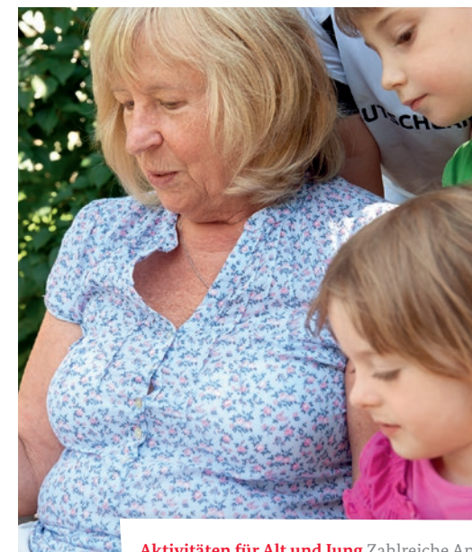
Aktivitäten für Alt und Jung Zahlreiche Angebote der Mehrgenerationenhäuser bereiten Jung und Alt gleichermaßen Freude.