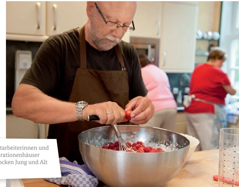
Gemeinsam genießen Mitarbeiterinnen und Mitarbeiter der Mehrgenerationenhäuser kochen gemeinsam und locken Jung und Alt an einen Mittagstisch.

Zusätzlich ermöglichen die Häuser mit fast 100 Qualifizierungs- und Beratungsangeboten vielen Menschen eine Fortbildung im Bereich der Haushaltsnahen Dienstleistungen und garantieren regelmäßig eine hohe Qualität der Leistungen. Ob Demenzbegleiter-Fortbildung oder eine Beratung zur Existenzgründung – in den Häusern gibt es viel zu lernen. Nicht selten ist die Teilnahme an den Bildungsangeboten ein erster Schritt in Richtung Arbeitsmarkt.